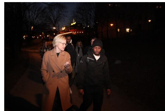
Helse- og omsorgsminister Ingvild Kjerkol (Ap) på besøk våren 2022

Kartlegging og dokumentasjon: Med systematisk og høy grad av tilstedeværelse ute i Oslo sentrum blir en naturlig oppgave å være Oslo kommunes «øyne og ører» på gata. Oppfølgingsarbeidet og samarbeid med andre gir også en viktig kunnskap om så vel situasjonen og behov blant innbyggere og hvordan disse møtes av ulike aktører. På oppdrag fra egen administrasjon eller politisk ledelse kan Uteseksjonen raskt levere dokumentasjon og beskrivelser fra vårt arbeid i Oslo sentrum. Hurtig kartlegging og Handling (HKH) brukes som verktøy for større kartlegginger på bestilling fra egen administrasjon. Siden 2012 har Velferdsetaten publisert 5 større HKH-rapporter som Uteseksjonen har utarbeidet i samarbeid med KORUS Oslo ;