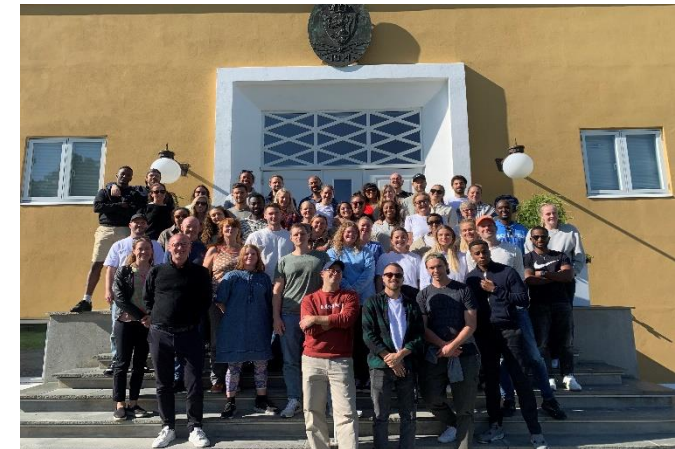
Fra Uteseksjonens internseminar 2023

Uteseksjonen har over tid vektlagt mangfold ved rekruttering av ansatte. Personalgruppen utgjør per 2024 et mangfold hva angår bakgrunn og kompetanse.