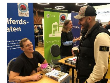
Fra stand på «Fyll dagene»

Oppfølgingsarbeid: Individuelt og fleksibelt oppfølgingsarbeid gis i nært samarbeid med den enkelte, pårørende og øvrig hjelpeapparat utføres daglig, og utgjør en vesentlig del av tjenestene som Uteseksjonen yter. Oppfølging kan skje akutt fra gata eller planlagt andre steder. Omfang og type oppfølging utføres etter behov, noen ganger gjennom en oppfølgings-økt men oftest vil innbyggere og tilreisende trenge flere oppfølginger i ulike perioder. Oppfølgingsarbeidet forankres som oftest i tett samarbeid med bydel eller hjemkommunes førstelinje ( NAV og barneverntjeneste ). Hver person vi gir oppfølging skal ha 2 kontaktpersoner for å sikre tilgjengelighet, kvalitet og en lav terskel. Når det er hensiktsmessig kan vi koble på psykologtjenesten vår eller andre forsterka innsatser. I 2023 fikk 1443 ulike personer oppfølging fra Uteseksjonen, hvorav 828 var under 25 år. 566 personer som fikk oppfølging har tilhørighet fra ulike kommuner utenfor Oslo. 725 var Oslotilhørende og 152 er registrert som ukjent/utenlandsk.