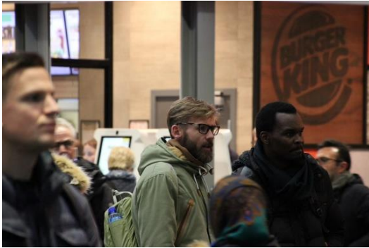
Fra samfelling med bydel Østensjø

SaLTo sentrum: SaLTo samarbeidet er Oslo kommunes SLT , Sammen lager vi et trygt Oslo. Bydelene har hver sin koordinator, og Uteseksjonen har koordinator for Oslo sentrum, Utdanningsetaten har 2 koordinatorstillinger. Vi deltar i regional gruppe sammen med sentrumsnære bydeler. Det gjennomføres 2 ukentlige møter med aktuelle aktører i Oslo sentrum for gjensidig oppdatering samt koordinering av arbeidet. Velferdsetaten har et SaLTo-sekretariat som samordner og koordinerer arbeidet i hele Oslo samt drifter delprosjekter. SaLTo-modellen er en desentralisert samarbeidsmodell for Oslo politidistrikt og Oslo kommune om rus- og kriminalitetsforebyggende arbeid blant barn og unge opp til 23 år. Uteseksjonen holder hvert år 4 større nettverksmøter, « Barn og unge i sentrum » der aktørene i sentrum møtes. I tillegg holdes operative samarbeidsmøter ukentlig.