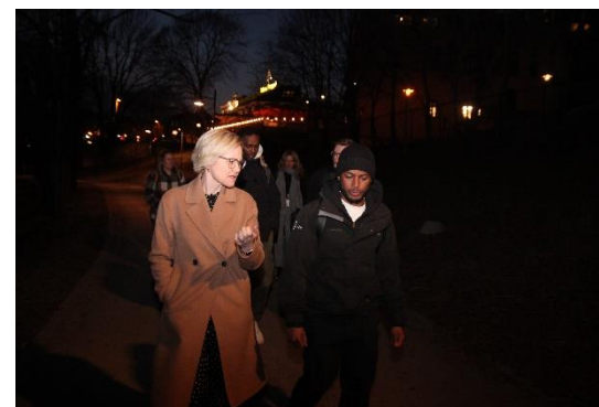
Helse- og omsorgsminister Ingvild Kjerkol (Ap) på besøk våren 2022

Kartlegging og dokumentasjon: Med systematisk og høy grad av tilstedeværelse ute i Oslo sentrum blir en naturlig oppgave å være Oslo kommunes «øyne og ører» på gata. Oppfølgingsarbeidet og samarbeid med andre gir også en viktig kunnskap om så vel situasjonen og behov blant innbyggere og hvordan disse møtes av ulike aktører. På oppdrag fra egen administrasjon eller politisk ledelse kan Uteseksjonen raskt levere dokumentasjon og beskrivelser fra vårt arbeid i Oslo sentrum. Hurtig kartlegging og Handling (HKH) brukes som verktøy for større kartlegginger på bestilling fra egen administrasjon. Siden 2012 har Velferdsetaten publisert 5 større HKH-rapporter som Uteseksjonen har utarbeidet i samarbeid med KORUS Oslo ;