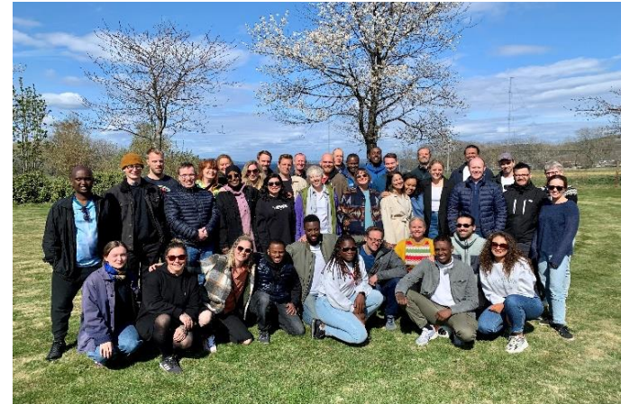
Fra Uteseksjonens internseminar 2022

Uteseksjonen har over tid vektlagt mangfold ved rekruttering av ansatte. Personalgruppen utgjør per 2022 et mangfold hva angår bakgrunn og kompetanse.