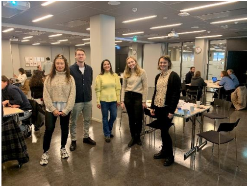
Fra dialogkonferanse om samarbeid mellom bydel Grorud og Uteseksjonen ifm videreutdanning i nsvkosialt arbeid med barn og unge

Felles innsats for utsatt ungdom i regi av Bydel Gamle Oslo.